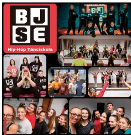
A BlackJam! Sportegyesület két évvel ezelőtt Prima díjra jelölték

A gyerekek nagyon lelkesek, még a pandémia miatt kialakult helyzet sem zengte kedvüket, online folytatják az edzéseket.