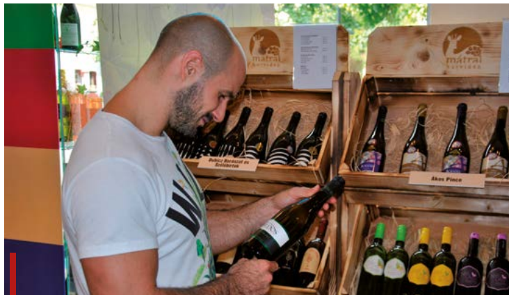
A Tourinform Iroda borshopjában a mátrai borvidék borait is meg lehet vásárolni

A 2018-ban létrejött Borshop is eredményes évet zárt az irodában, amelynek kínálata