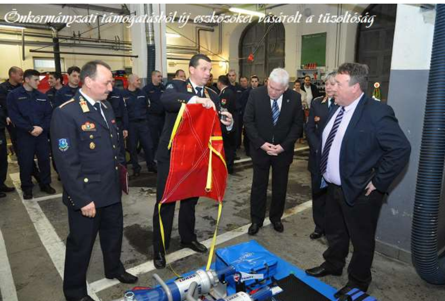
Önkormányzati támogatásból új eszközöket vásárolt a tűzoltóság