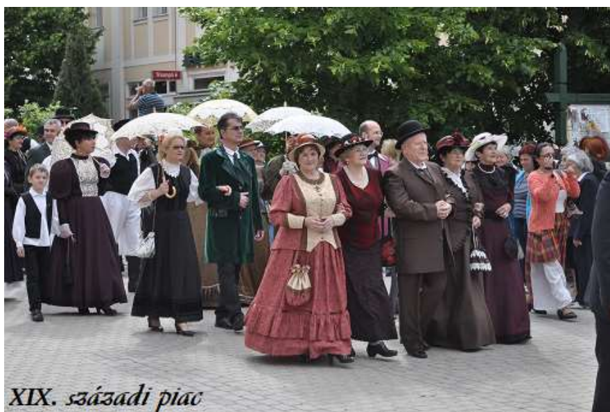
XIX. századi piac