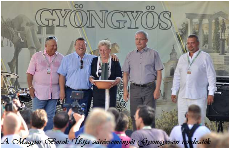
A Magyar Borok Útja záróeseményét Gyöngyösön rendezték