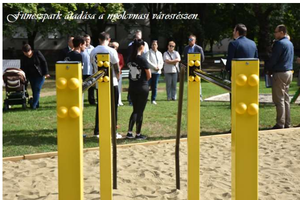
Fitnesspark átadása a nyolcmási városrészen