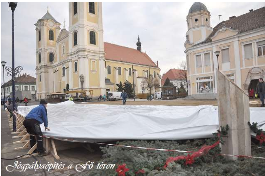
Jégpályaépítés a fő téren