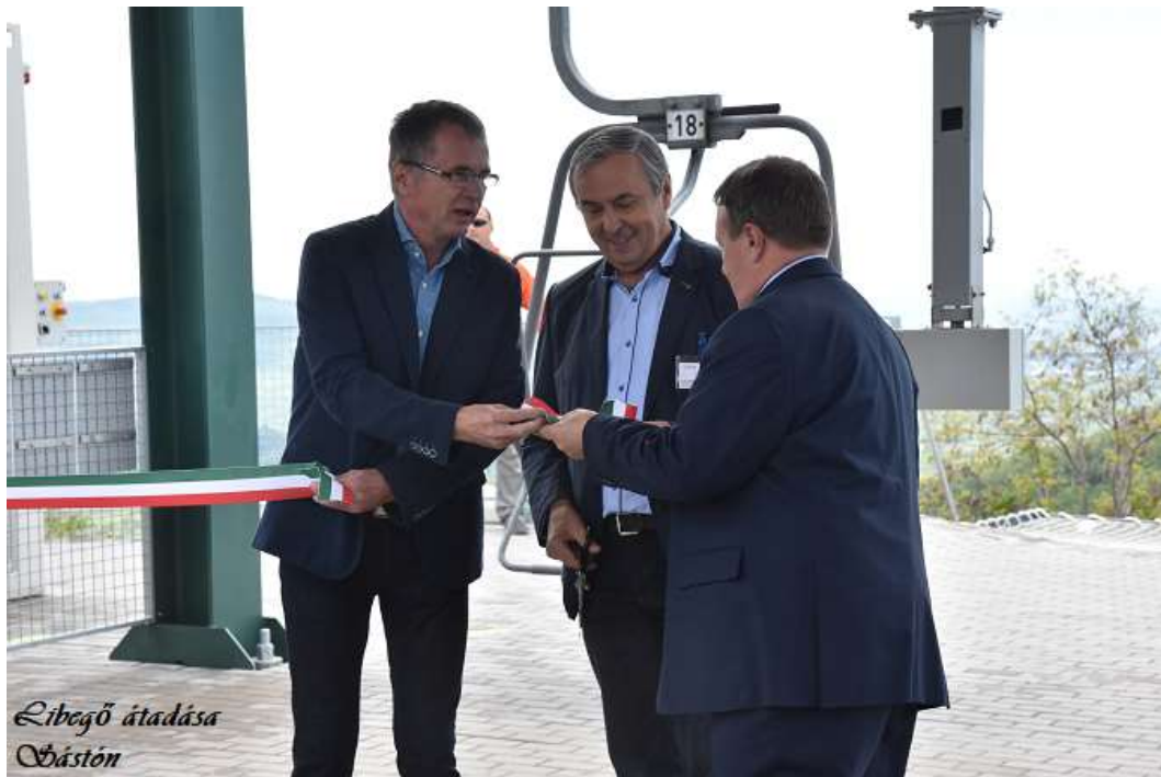
Libegő átadása Órástón