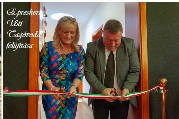
É. prakeresztény Úti Tagóvoda felújítása